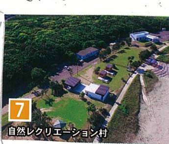
7 自然レクリエーション村