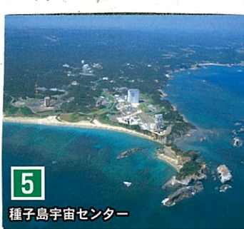
5 種子島宇宙センター

総面積約970万平方 メートル!! 世界一美しいロケット発射場 ついでです!! 宇宙についてTECIN しれす!!