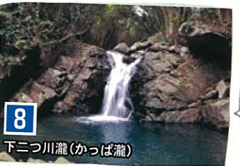
8 下三ツ川瀧(かっぱ瀧)