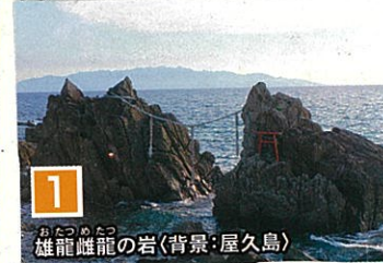
1 雄龍雌龍の岩(背景: 屋久島)

嵐の存と海に 投げた石は、大隅 の海水変り たに!! 右が雄龍!! 左が雌龍!!