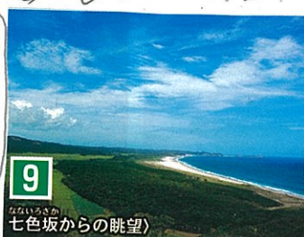
9 七色坂からの眺望